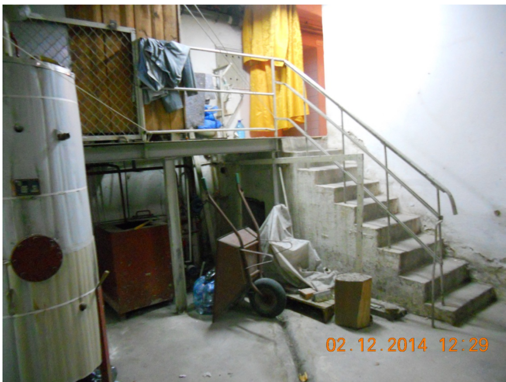
Fot. Nr 2 Pomieszczenie węzła – widok na schody na antresolę i stalową konstrukcję antresoli