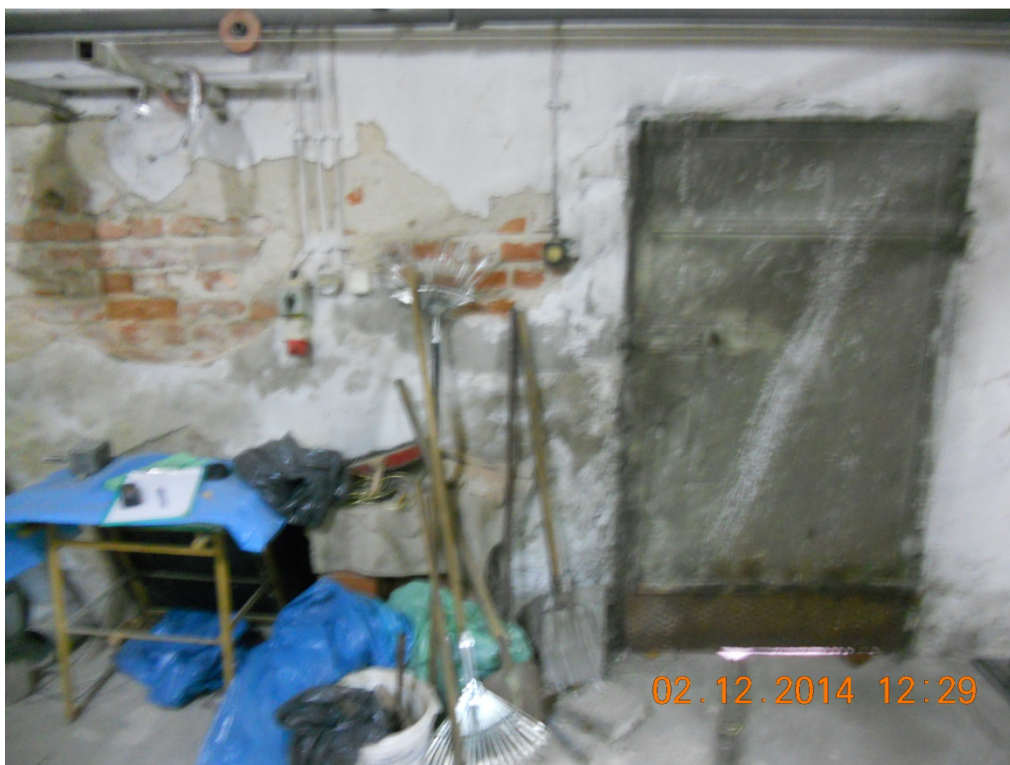
Fot. Nr 1 Pomieszczenie węzła – widok na zniszczone tynki ścianie zewnętrznej i stalowe drzwi do węzła do wymiany