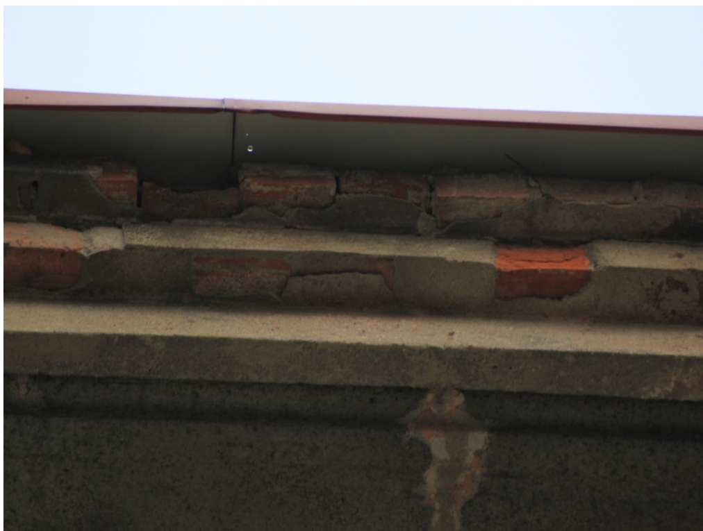
Fot. Nr 6 Gzys wieńczący od strony boiska – do wymiany cegły w ostatniej warstwie