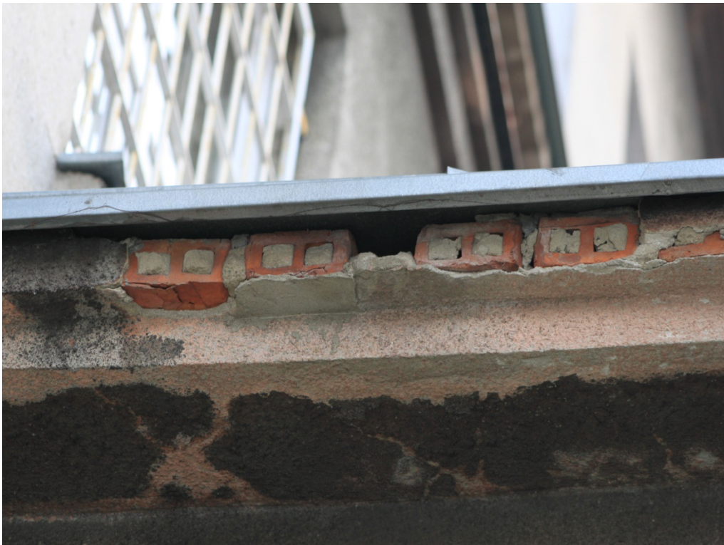
Fot. Nr 11 Gzys na łączniku – konieczne przemurowanie i ponowne otynkowanie