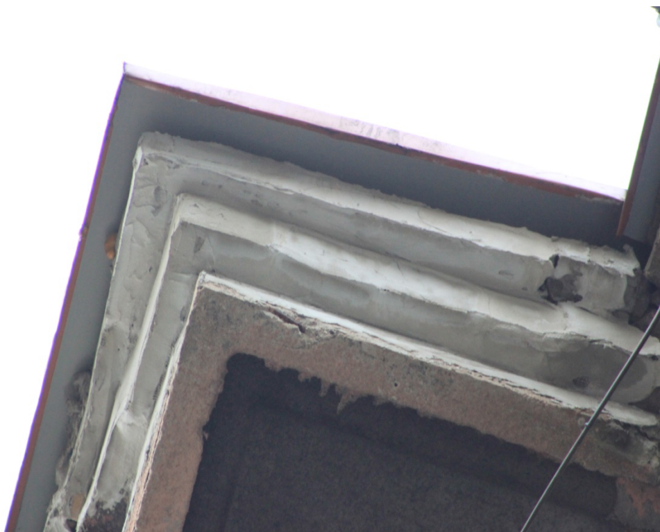
Fot. Nr 10 Fragment j.w.