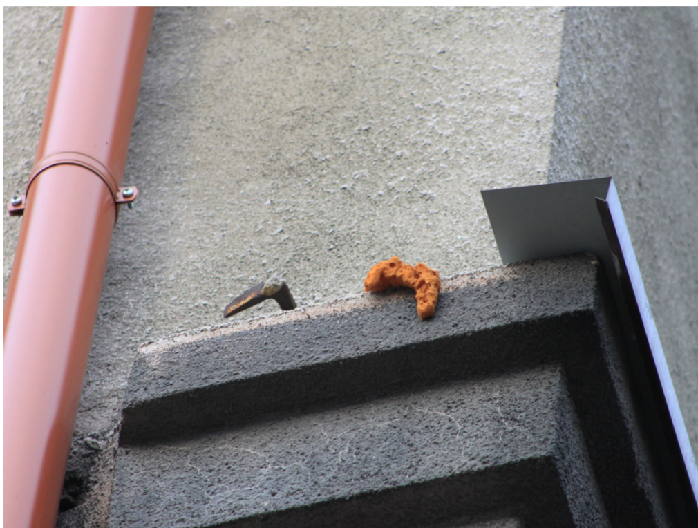
Fot. Nr 4 Gzysm międzypiętrowym w narożniku południowo-wschodnim – do uzupełnienia obróbka blacharska