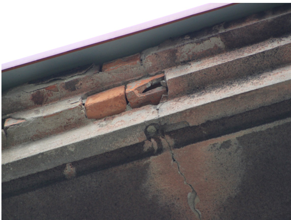
Fot. Nr 8 Gzyms wieńczący – fragment do przemurowania