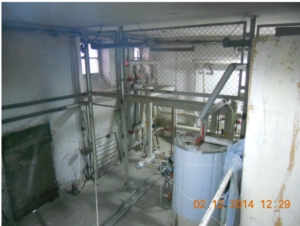
Fot. 3 Pomieszczenie węzła – widok na stalowe oddzielenie urządzeń technologicznych i okna w ścianie zewnętrznej do wymiany