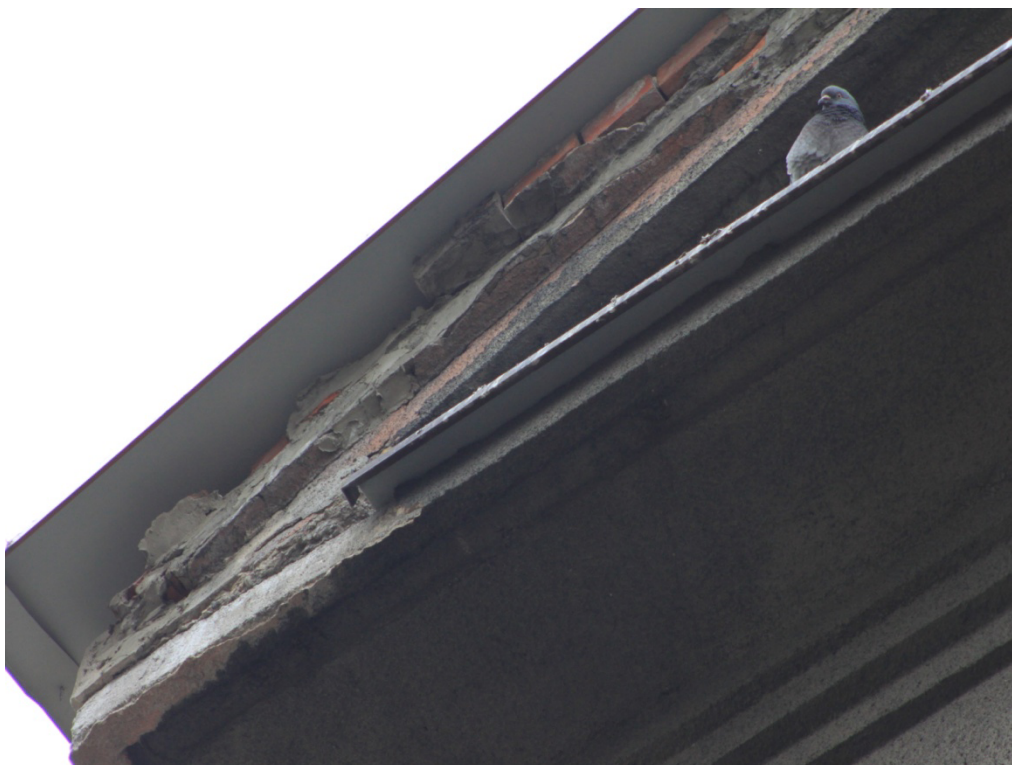
Fot. Nr 9 Tympanon nad wejściem głównym – tynk do zbitcia i wykonania od nowa