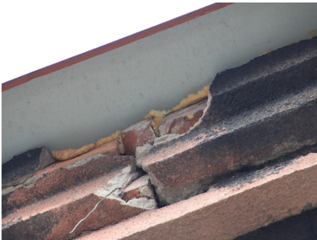
Fot. Nr 7 Gzyms wieńczący – fragment do przemurowania