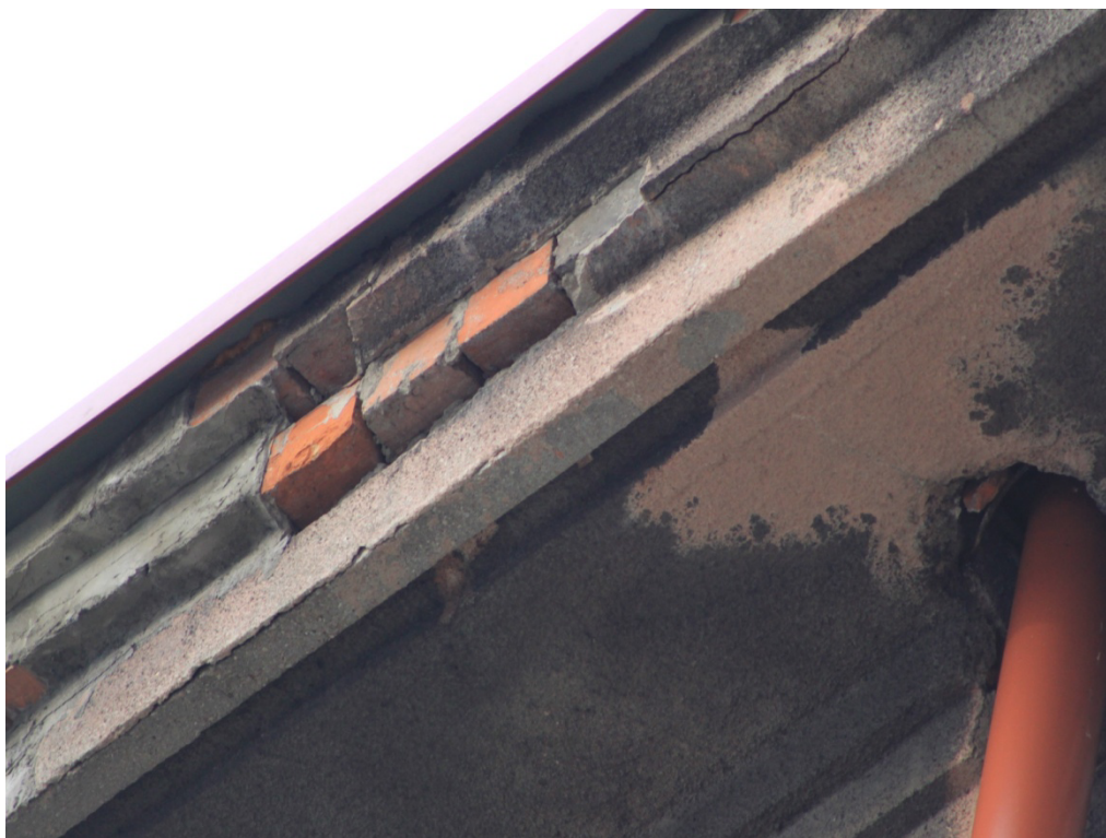
Fot. Nr 5 Gzys wieńczący od strony boiska – tynk do uzupełnienia